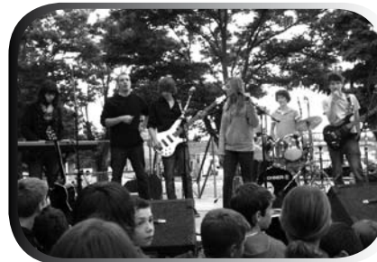
« Lightness »