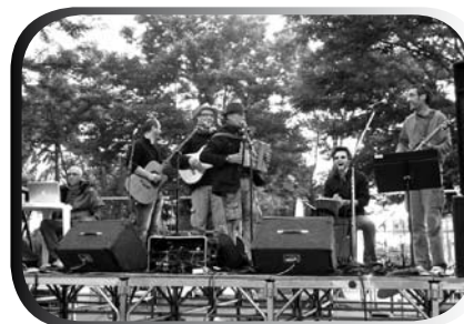
« La Rustine »

Merci aux nombreux spectateurs, au Comité des Fêtes qui a assuré le ravitaillement du public, aux services techniques ainsi qu'à tous les élus de la commission association pour leur travail efficace, comme à chaque évènement dans notre village.