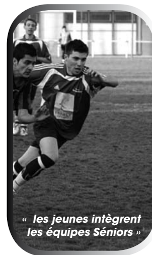
« les jeunes intègrent les équipes Séniors »

Outre cette manifestation d'envergure, l'OGFC travaille d'ores et déjà à la préparation d'un loto auquel nous espérons vous voir nombreux.