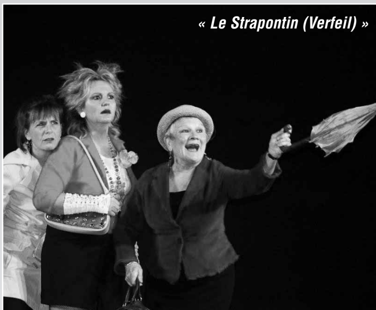
« Le Strapontin (Verfeil) »

Le succès de la manifestation est due également aux nombreux bénévoles qui se sont succédés et dépensés tout au long de ces trois jours pour accueillir au mieux artistes et public.