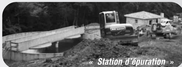
« Station d'épuration »

Ce chantier qui comprend le rabaissement de certains trottoirs et la signalisation d'une piste cyclable entre la rue du Professeur Remond et la Mairie est en cours. Ce chantier entrainera la fermeture définitive de la voie de Bus aux voitures.