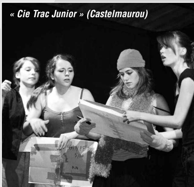
« Cie Trac Junior » (Castelmaurou)