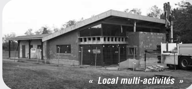
« Local multi-activités »