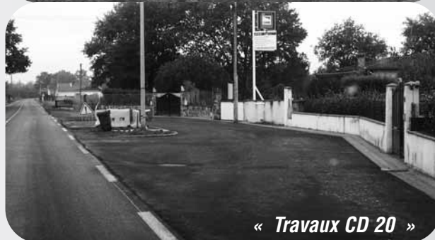
« Travaux CD 20 »