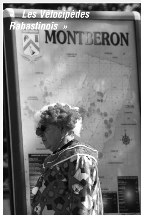
« Les Vélocipèdes Rabastinois »