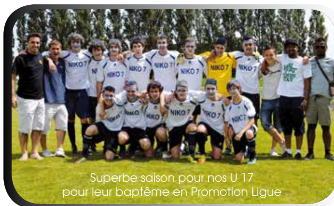
Superbe saison pour nos U 17 pour leur baptême en Promotion Ligue