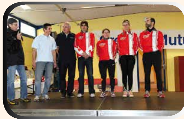
Les champions régionaux.