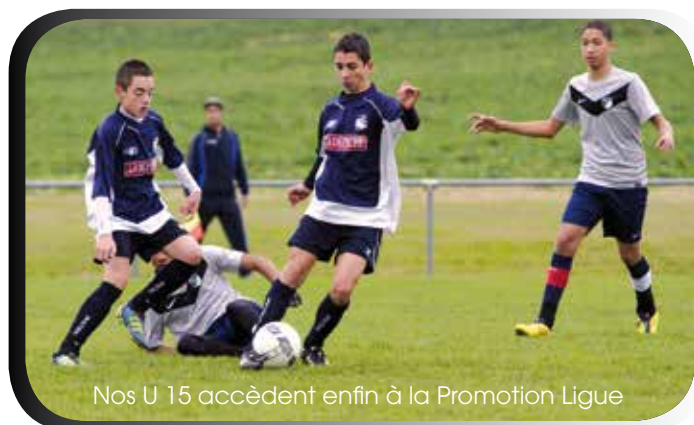
Nos U 15 accèdent enfin à la Promotion Ligue

Un petit mot du comité directeur du club qui œuvre saisons après saisons sans pause et dans l'ombre pour faire de notre cher OGFC ce qu'il est devenu, c'est-à-dire un club important avec cependant des moyens limités. C'est l'occasion pour nous de lancer un appel à toutes personnes désirent nous rejoindre pour apporter un regard neuf sur notre évolution et une contribution à