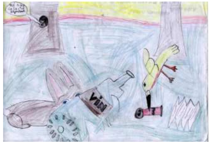
Dorian MARCZYKO Classe CE1/CE2 de Mme Garçon

Pour cette occasion, un concours de dessin destiné aux écoles a été organisé. Voici les œuvres des gagnants :